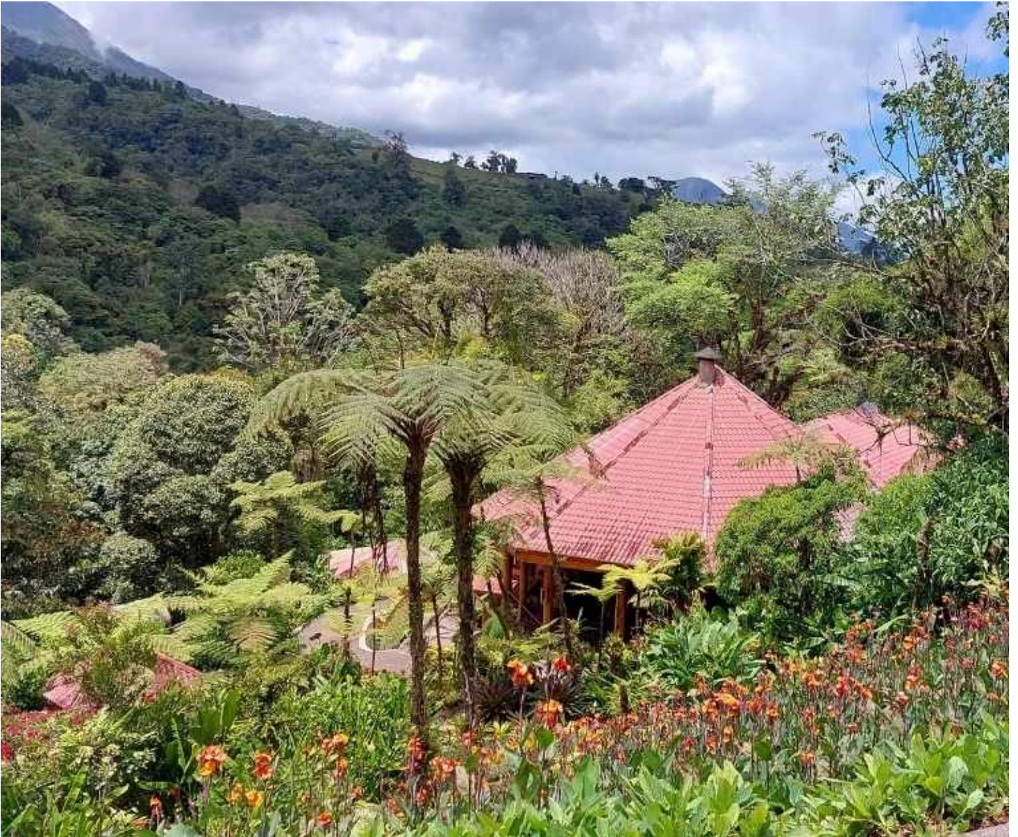
Vue sur le paysage de La Paz Waterfall Gardens