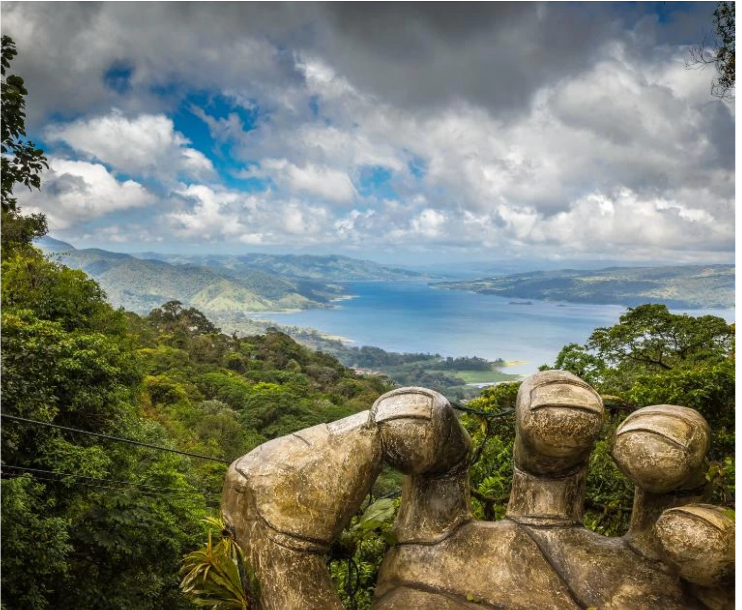
Vue sur le lac Arenal depuis le téléphérique