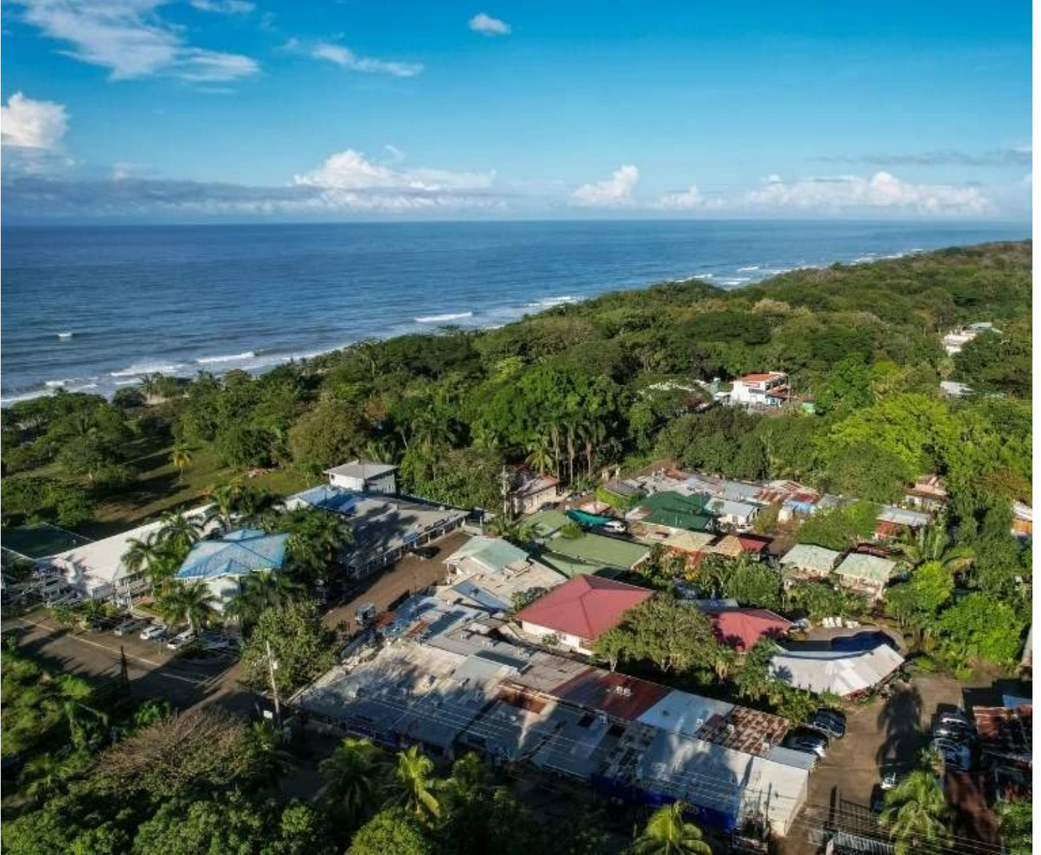
Village de Santa Teresa

Direction la côte pacifique pour rejoindre Santa Teresa , un véritable petit coin de paradis niché à l'ouest de la péninsule de Nicoya. Réputé pour son ambiance décontractée et son cadre idyllique, ce village côtier séduit par ses plages de sable blanc, ses vagues mondialement prisées par les surfeurs, et ses couchers de soleil spectaculaires. Laissez-vous porter par l'ambiance paisible de cet endroit empreint de charme et de nature. Nuit en chambre Pool View à l' Esencia Hotel & Villas 3* .