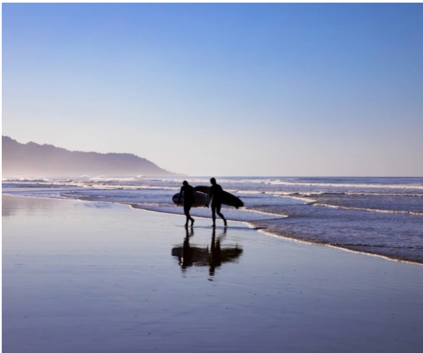
Surfeurs sur la plage de Santa Teresa

Encore une belle journée pour explorer Santa Teresa à votre rythme ou vous détendre. Flânez le long des plages infinies, profitez des vagues pour vous initier au surf , explorez les environs à cheval ou découvrez la vie marine en plongée à Isla Tortuga . Vivez pleinement l'ambiance décontractée et chaleureuse de Santa Teresa !