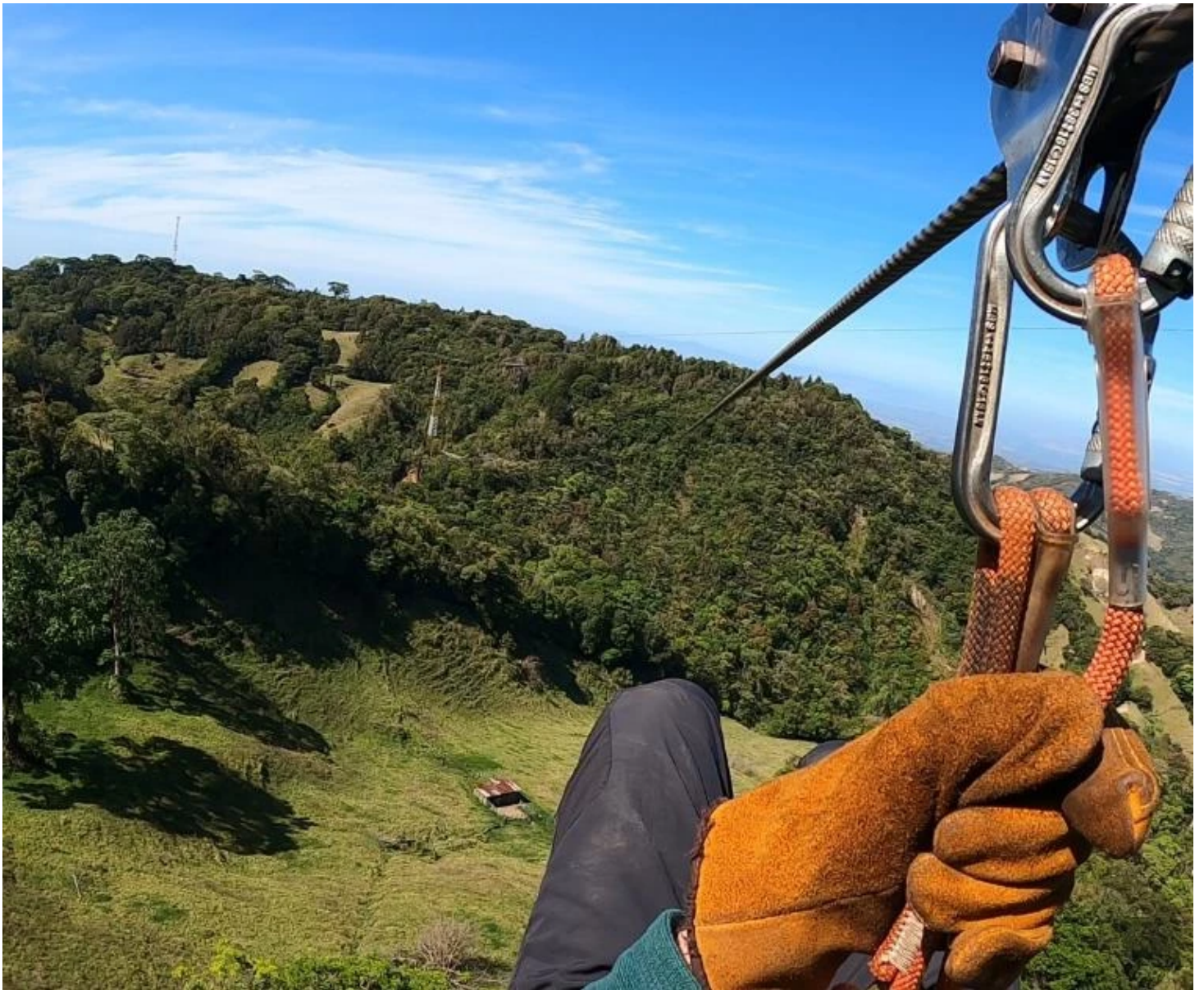
Tyrolienne dans la forêt nuageuse de Monteverde