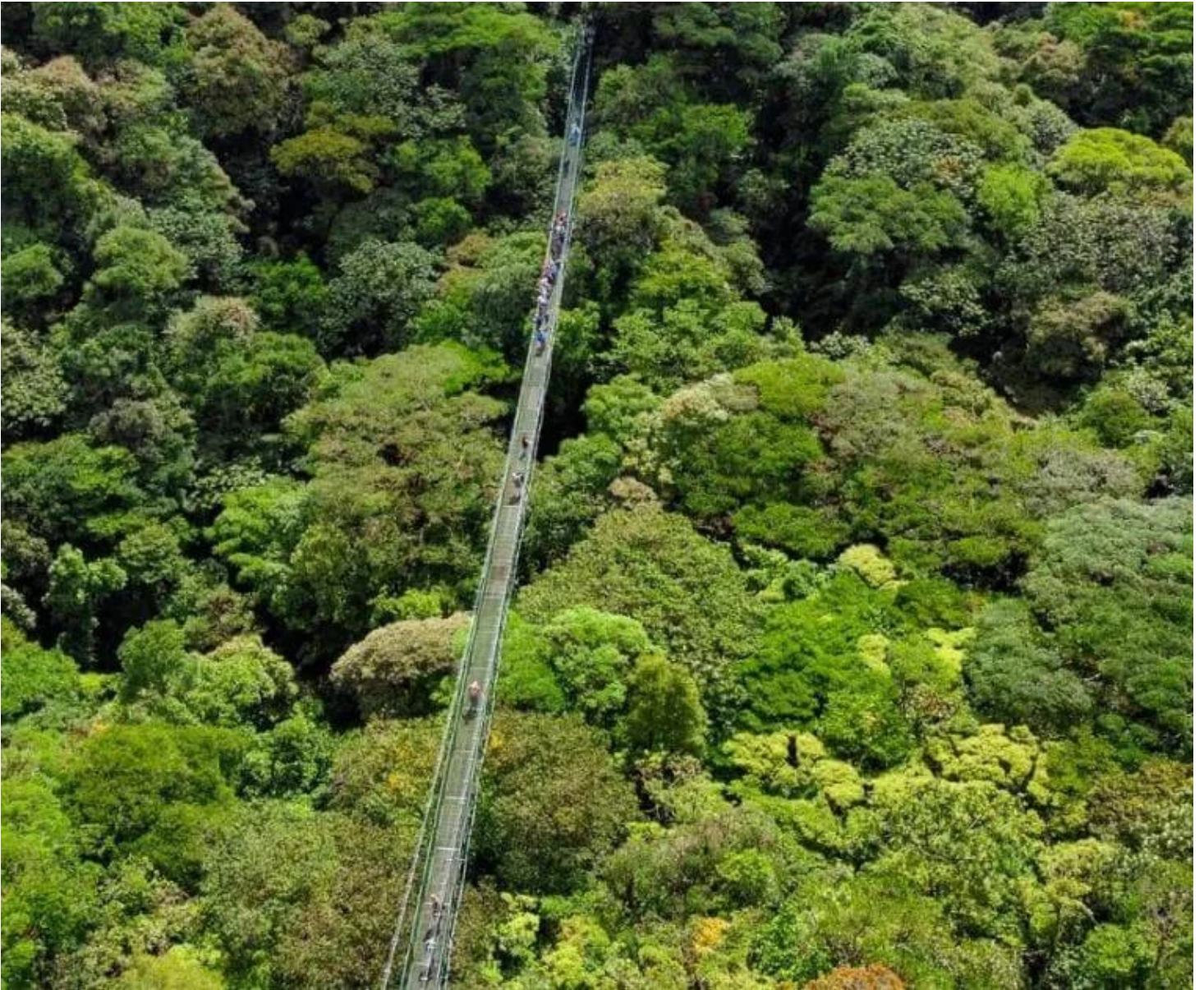
Vue aérienne sur le pont suspendu et la forêt de Monteverde