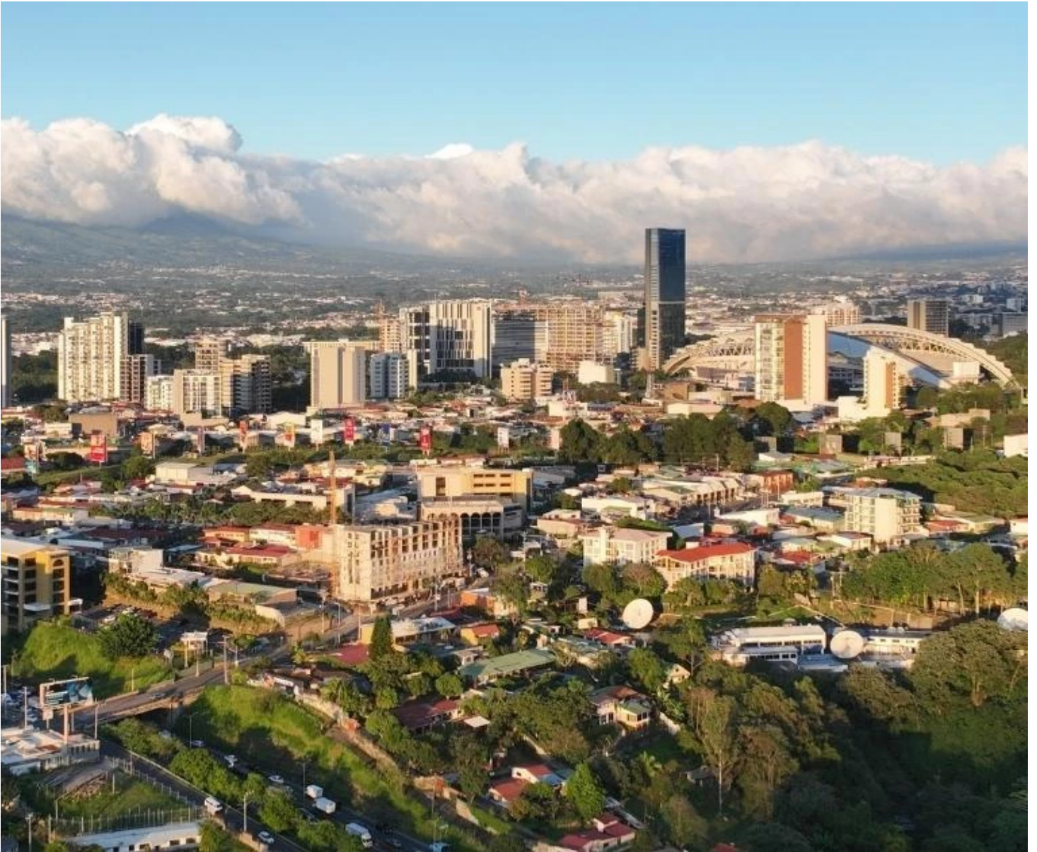
Panorama de San José