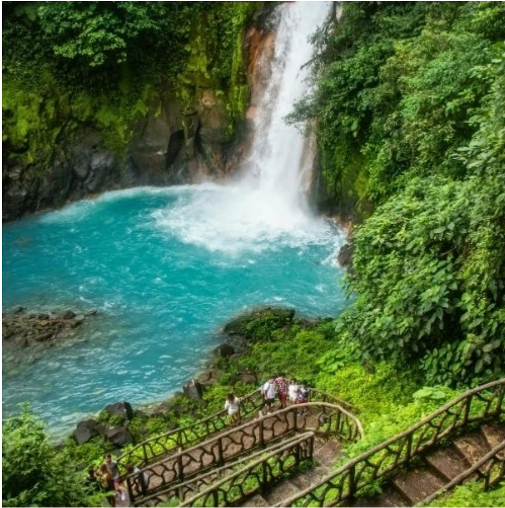
Cascade turquoise du Rio Celeste dans le parc Tenorio