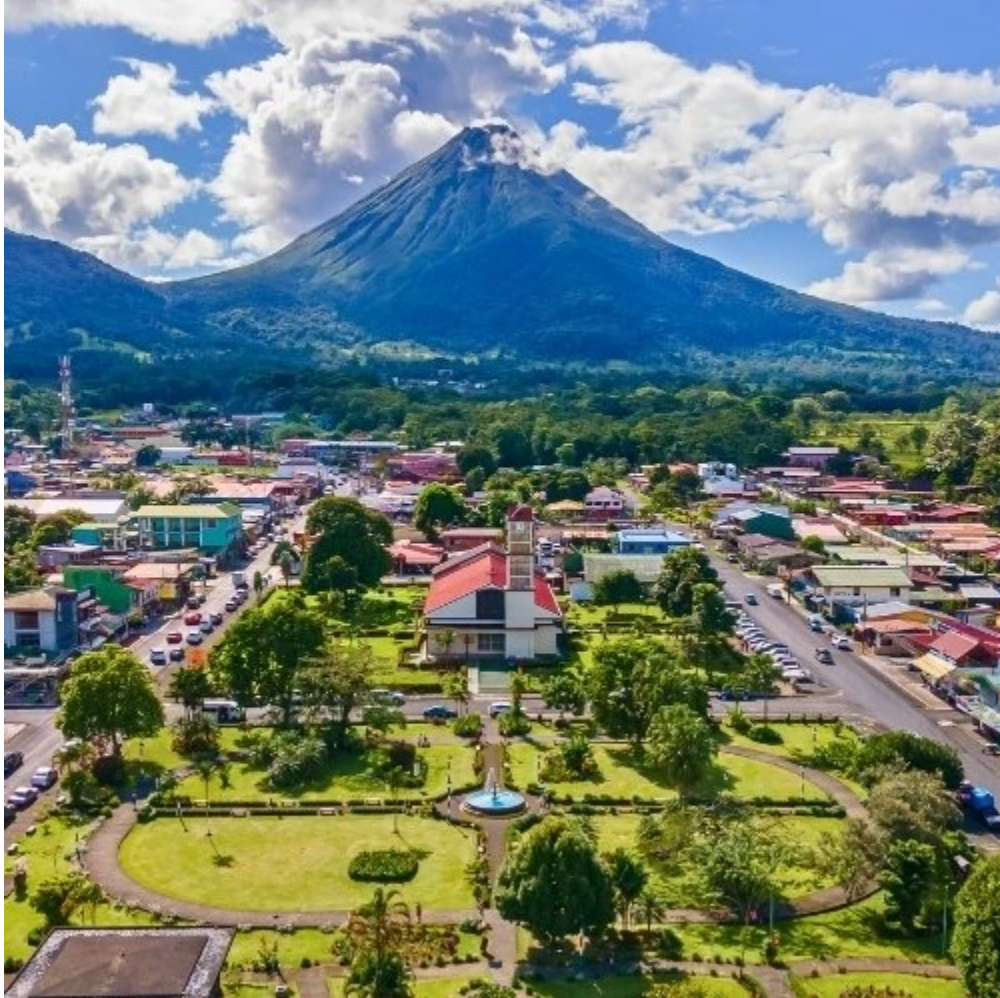
Vue aérienne de la ville de La Fortuna

Nuit en chambre supérieure, dans le cadre enchanteur de cet écolodge parfaitement intégré à son environnement tropical.