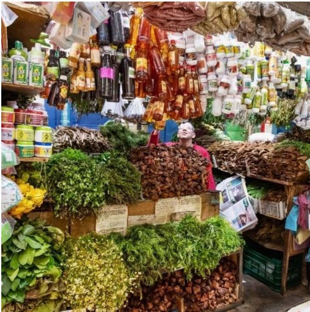
Marché Central de San José

Restitution de la voiture et envol vers Paris.