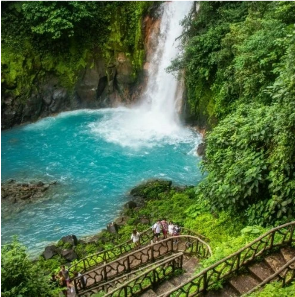
Cascade turquoise du Rio Celeste dans le parc Tenorio