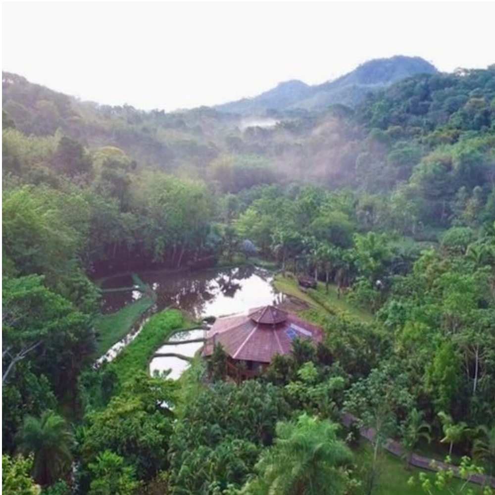
Environnement naturel du Macaw Lodge à Carara