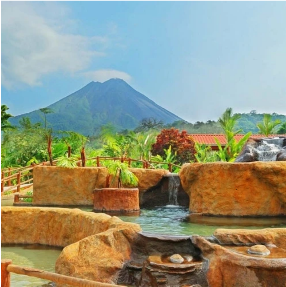
Sources chaudes du Volcano Lodge à La Fortuna