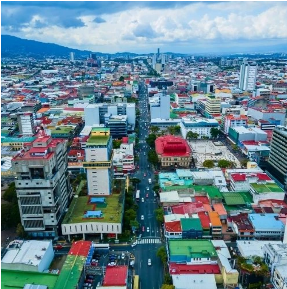
Vue aérienne sur Central Avenue à San José