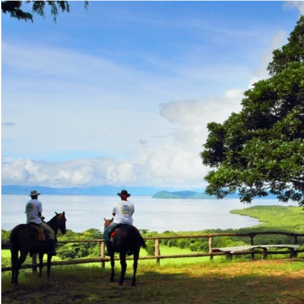
Balade à cheval dans la réserve de la Ensenada à Abangaritos