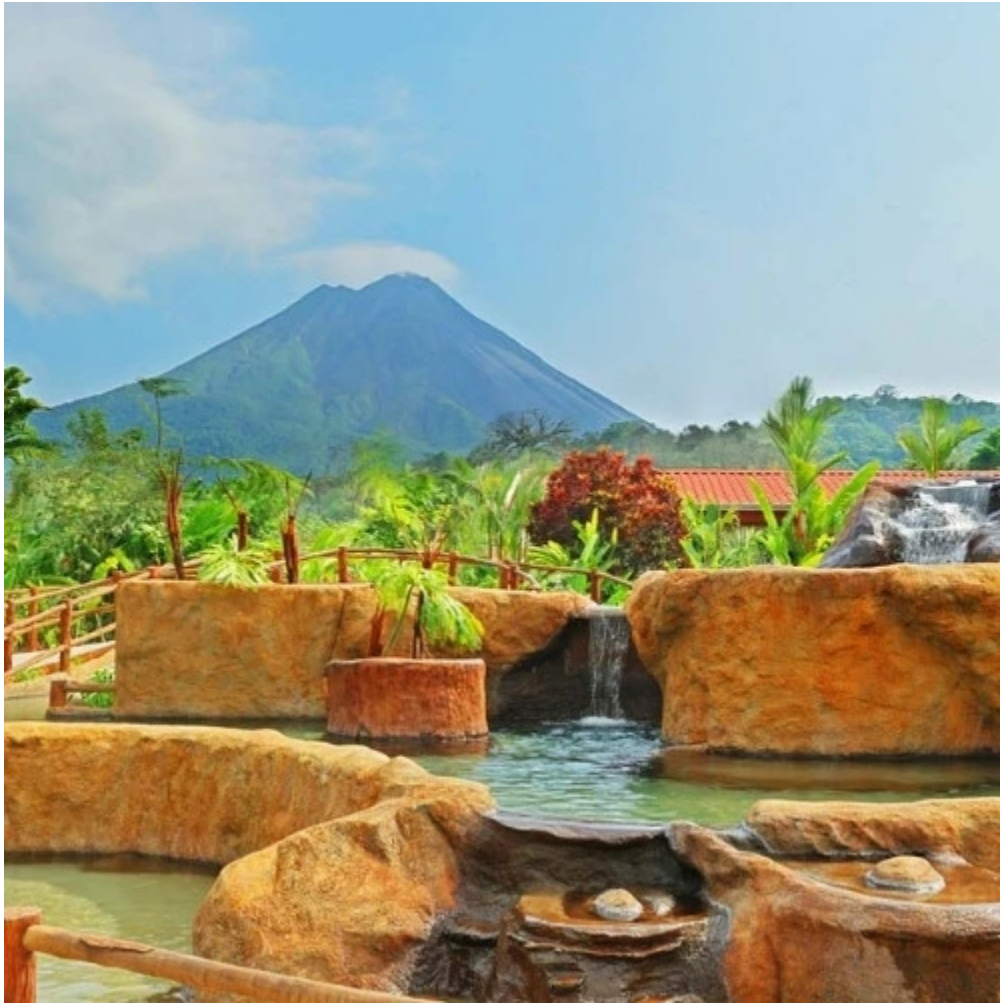
Sources chaudes du Volcano Lodge à La Fortuna