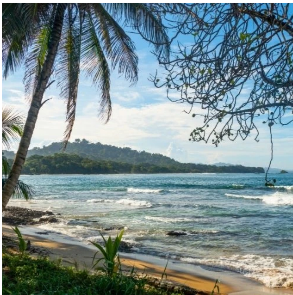
Belle plage de Cocles à Puerto Viejo de Talamanca

Ne manquez pas la plage de Cocles , parfaite pour une baignade ou une promenade, et imprégnez-vous de l'ambiance vibrante de Puerto Viejo, avec ses bars reggae, marchés locaux et sa cuisine caribéenne.