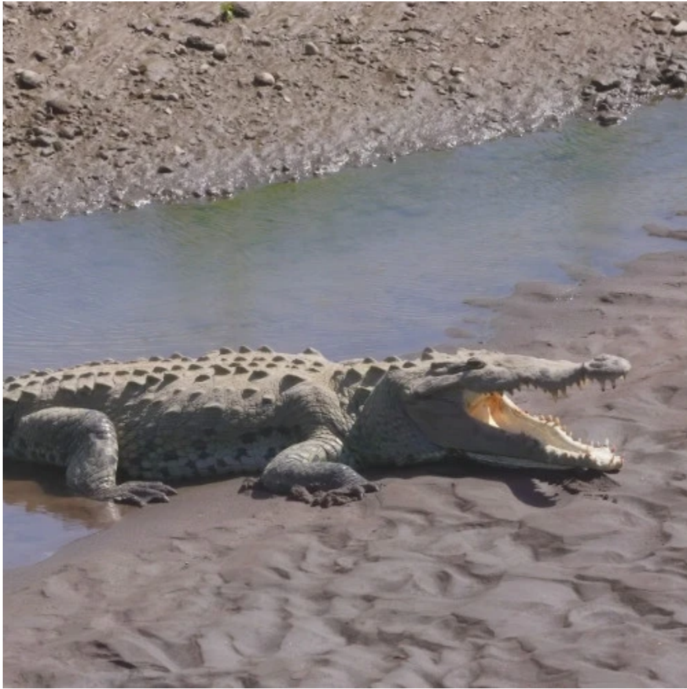
Un crocodile, gueule ouverte, sur les rives de la rivière Tarcoles