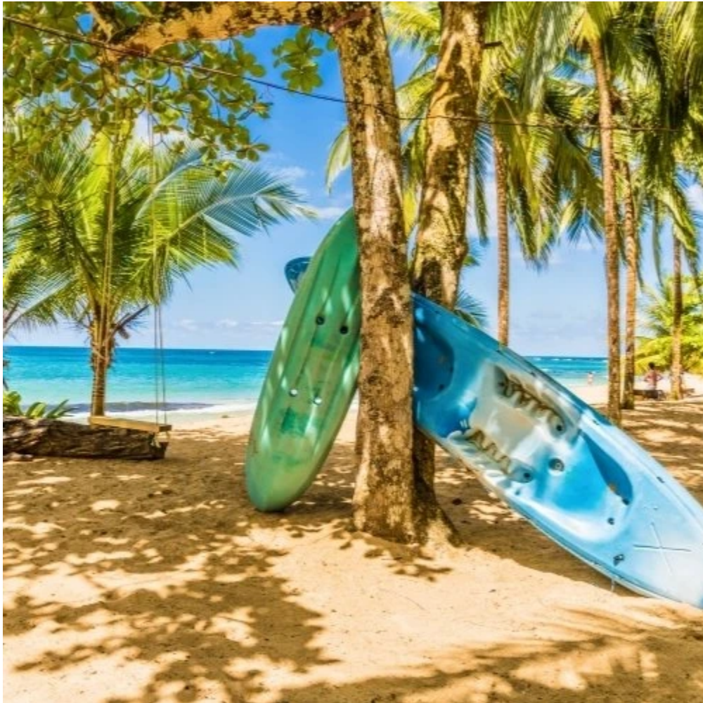
Kayaks posés sur le sable entre deux arbres à Punta Uva