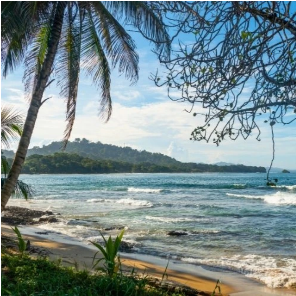
Belle plage de Cocles à Puerto Viejo de Talamanca

Ne manquez pas la plage de Cocles , parfaite pour une baignade ou une promenade, et imprégnez-vous de l'ambiance vibrante de Puerto Viejo, avec ses bars reggae, marchés locaux et sa cuisine caribéenne.