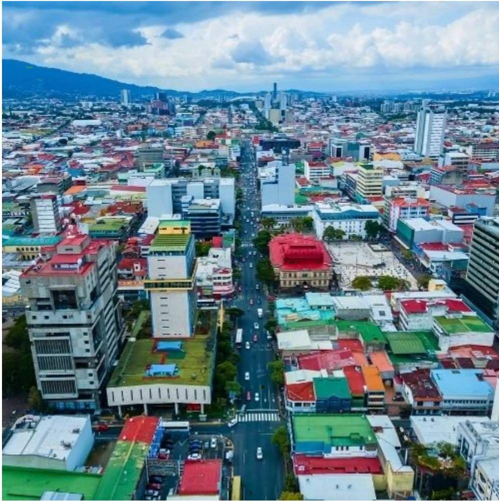
Vue aérienne sur Central Avenue à San José