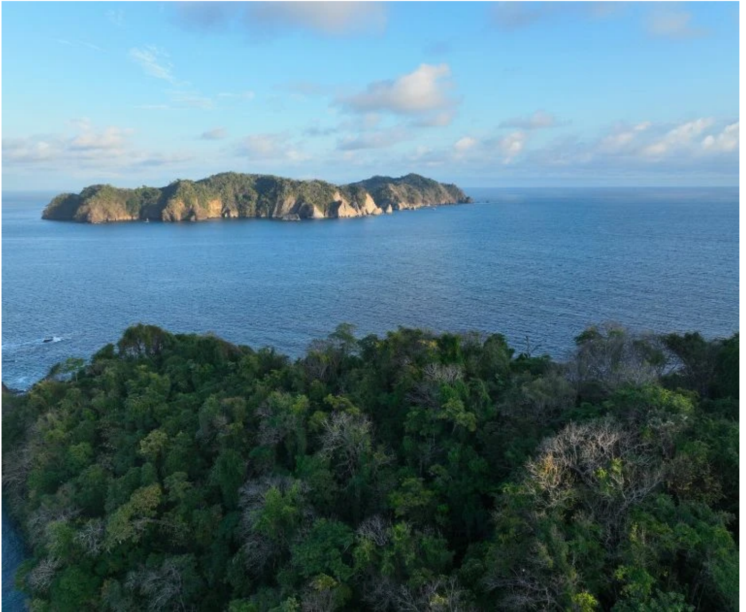
Vue aérienne sur Isla Tortuga depuis le Refuge national de Curu