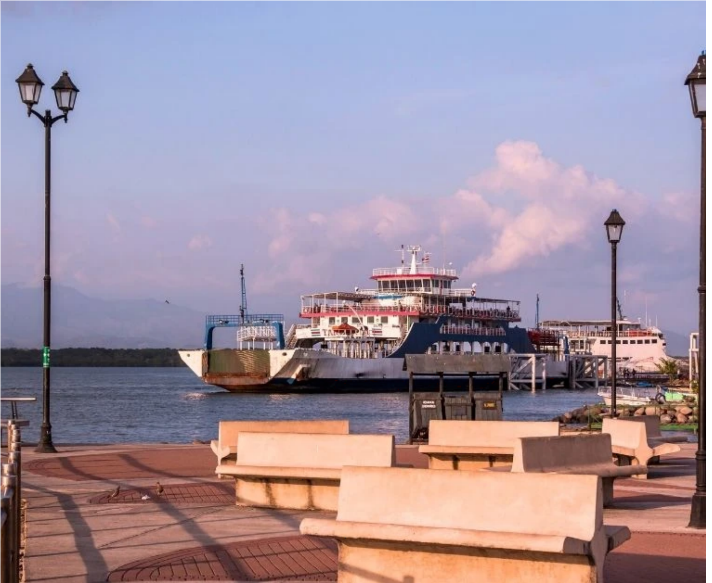
Embarcadère de ferry dans la ville de Puntarenas

Départ pour San José, avec une traversée en ferry jusqu'à Puntarenas. Restitution de votre véhicule de location avant votre vol retour vers Paris. Nuit à bord.