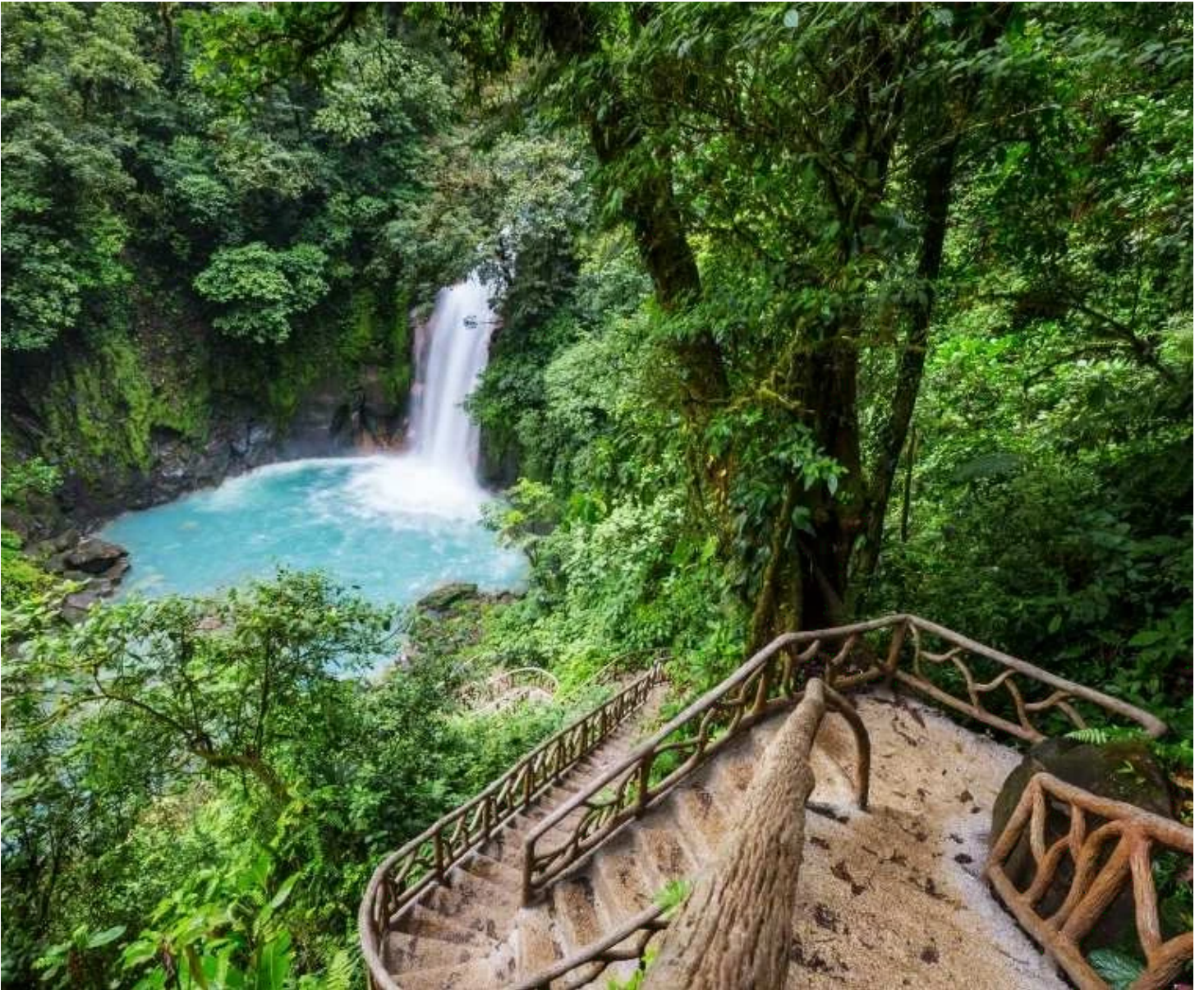
Cascade et lagon turquoise du Rlo Celeste à Bijagua de Upala