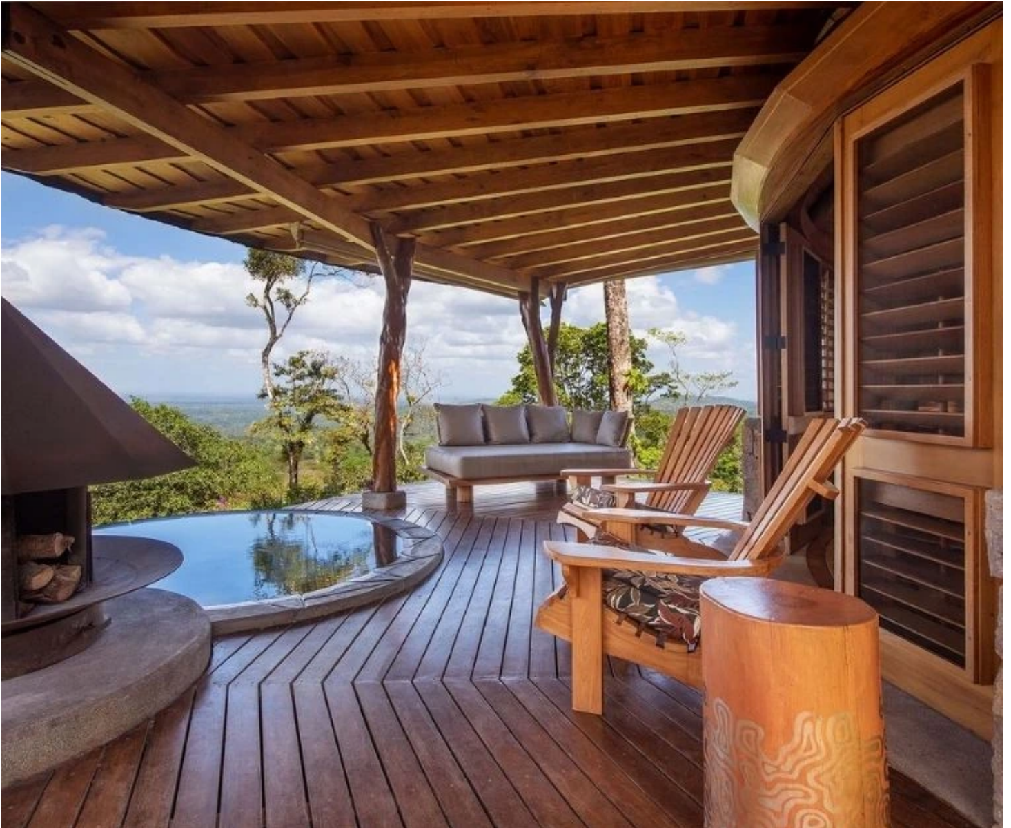
Terrasse du Luxury Lodge de l'hôtel Origins à Bijagua