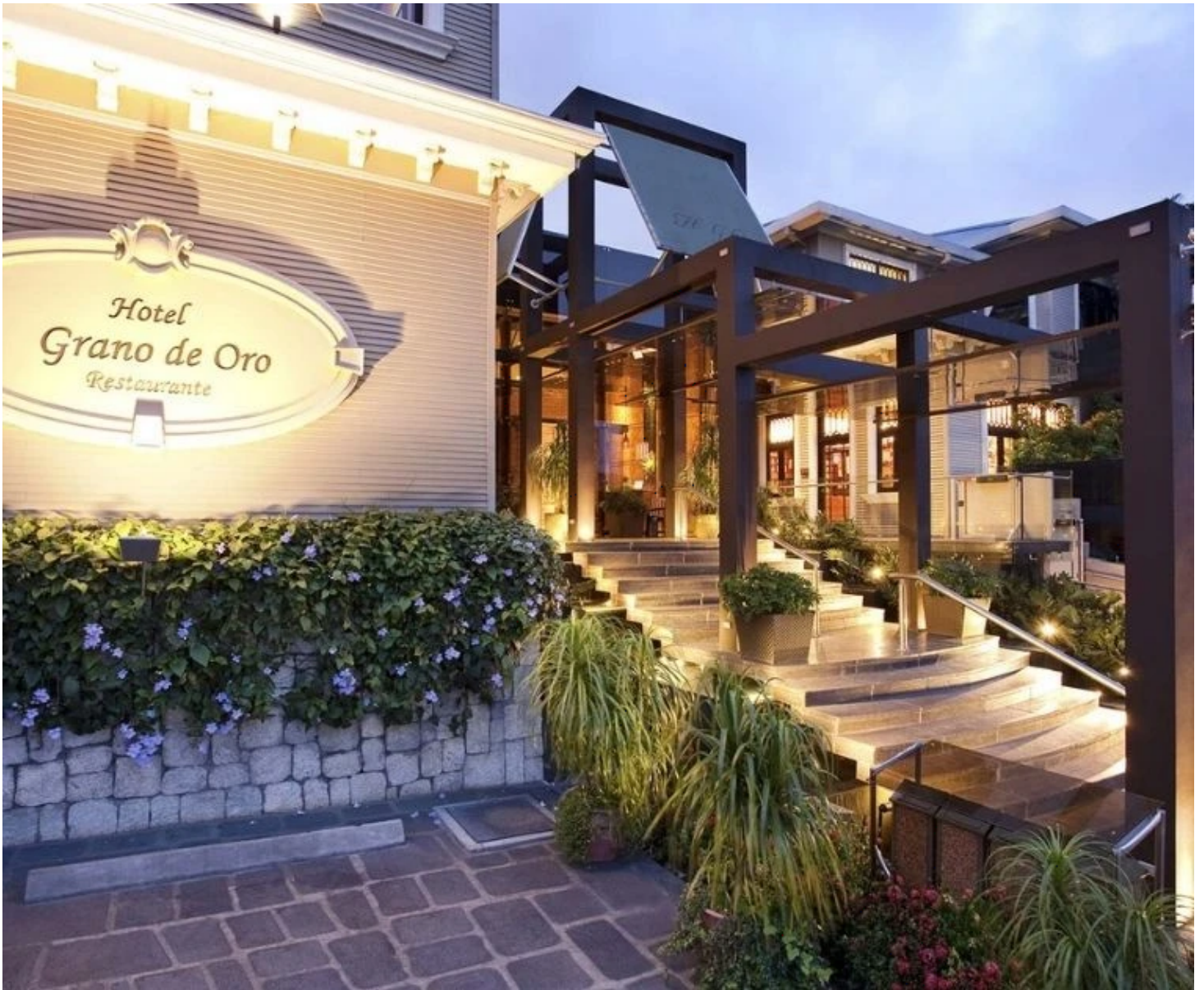
Façade de l'hôtel Grano de Oro à San José