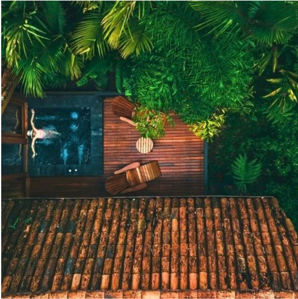
Jacuzzi extérieur sur la terrasse de la chambre à l'hôtel Amor Arenal