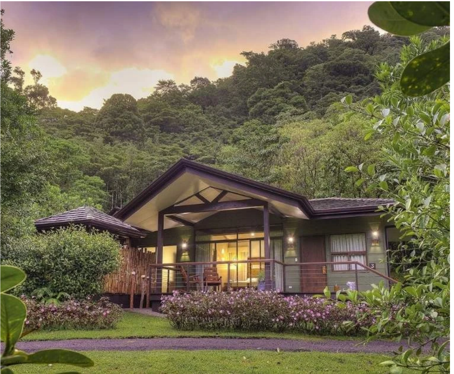
Suite deluxe du Silencio Lodge & Spa à Bajos del Toro