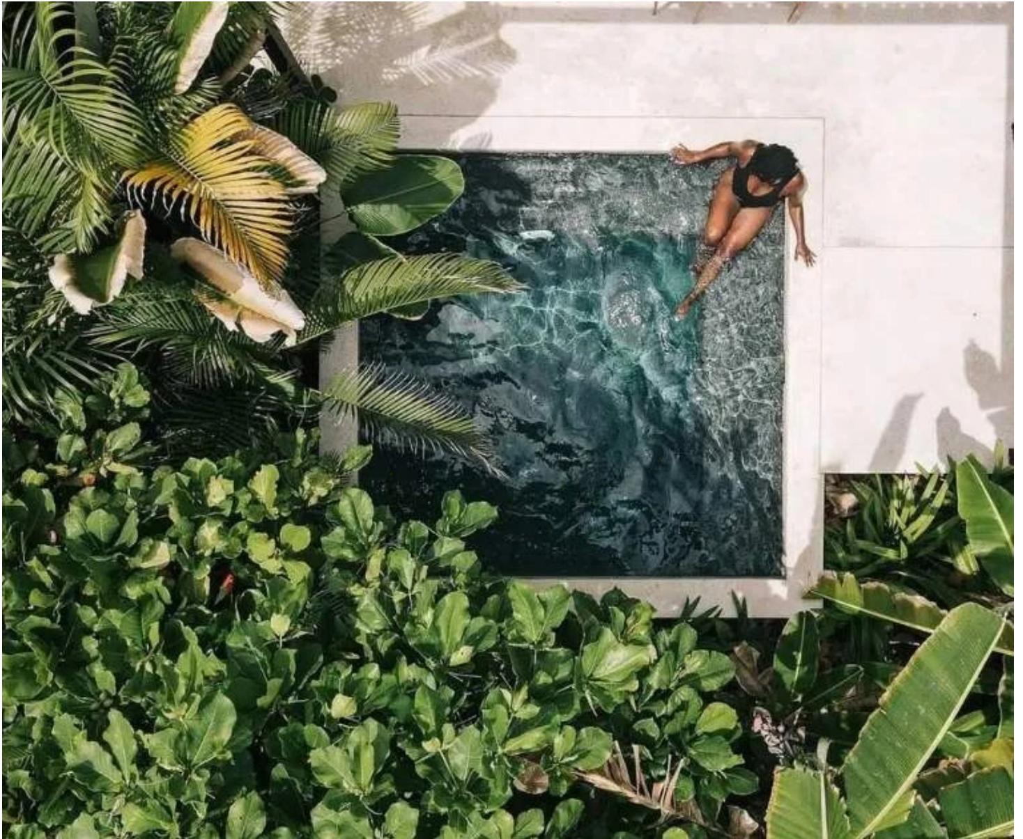
Piscine du Bungalow Ninta Beachfront de l'hôtel Nantipa à Santa Teresa