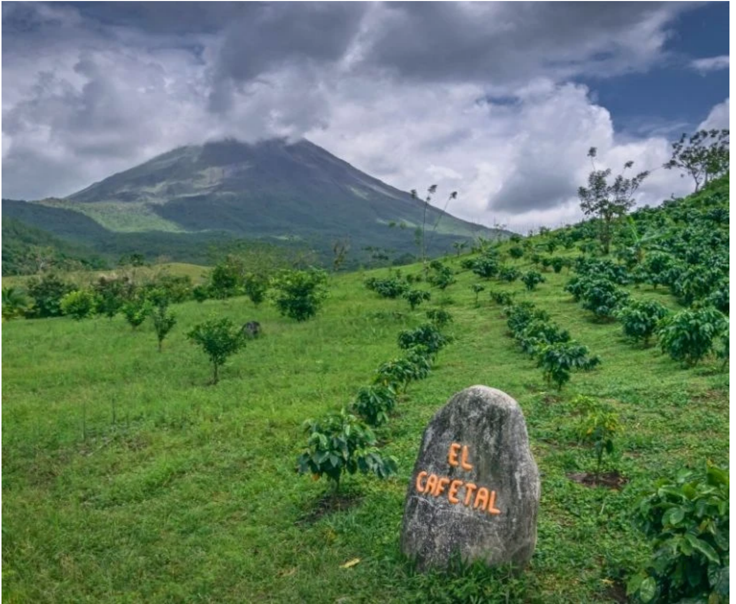
Plantation de café au pied du volcan Arenal