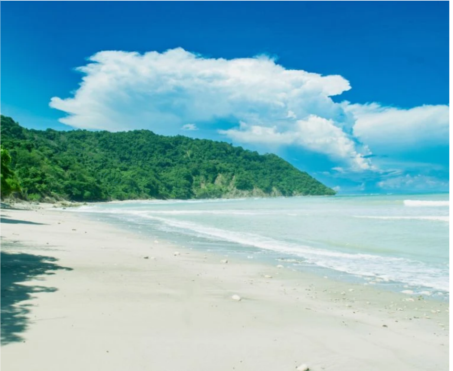
Plage de sable blanc de la réserve de Cabo Blanco

Cette journée est dédiée à la détente et à l'exploration de Santa Teresa et ses environs. Promenez-vous le long des plages idylliques, faites une balade à cheval , ou bien aventurez-vous dans la réserve naturelle de Cabo Blanco pour observer la faune locale, notamment les singes, les iguanes et les oiseaux tropicaux. En fin de journée, ne manquez pas le spectacle inoubliable du coucher de soleil sur l'océan Pacifique.