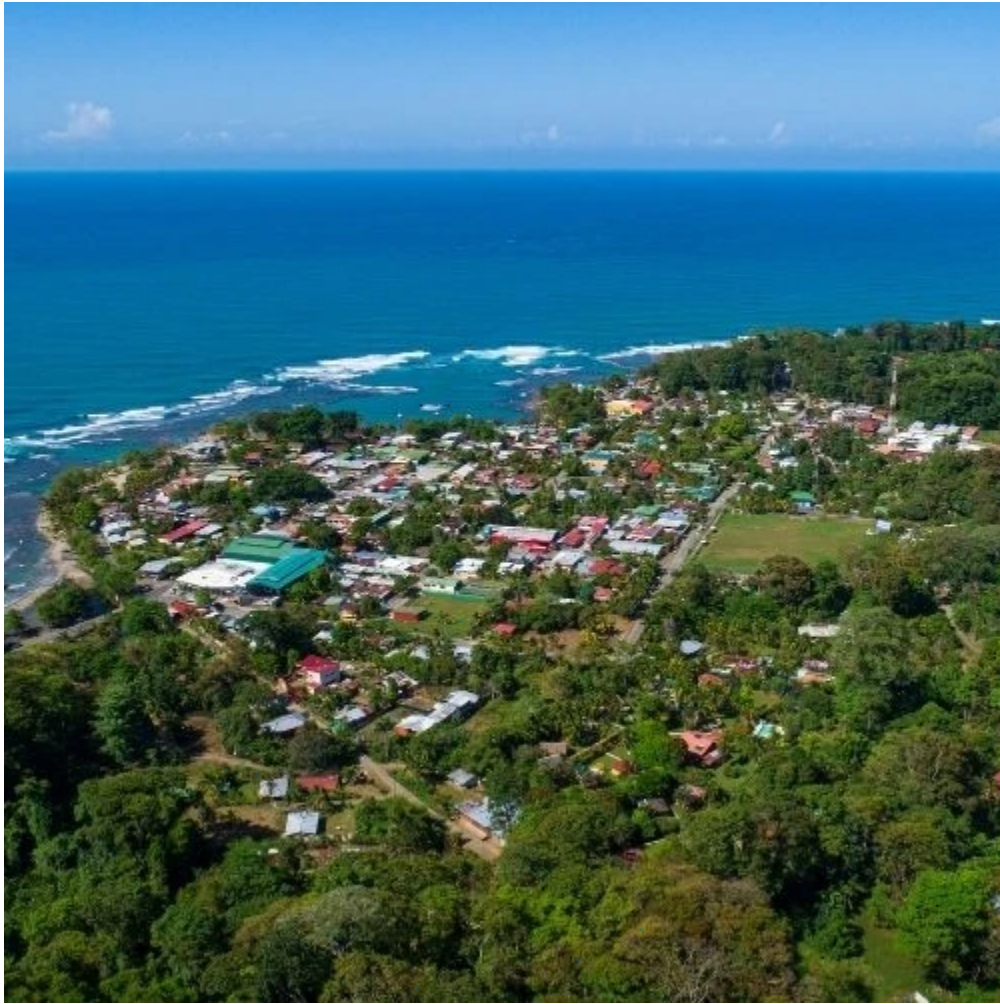
Vue aérienne sur Puerto Viejo de Talamanca, une ville nichée dans la jungle au bord de la mer des Caraïbes