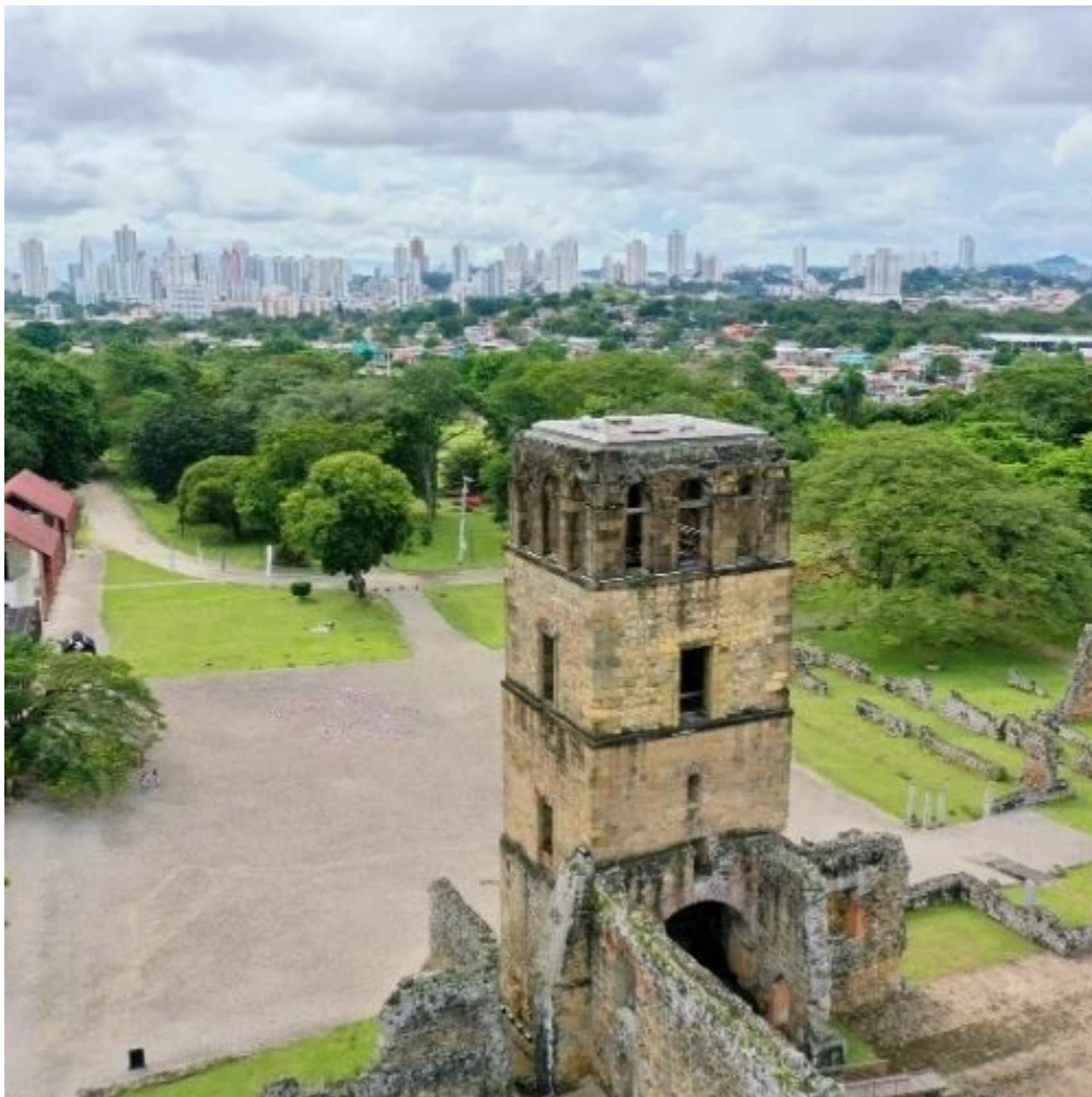
Les ruines de Panama la Vieja et la skyline de Panama City en arrière plan

En option : City Tour privé avec guide francophone : visite des ruines de Panama La Vieja et du musée interocéanique avec déjeuner (650 $ pour 2 personnes)