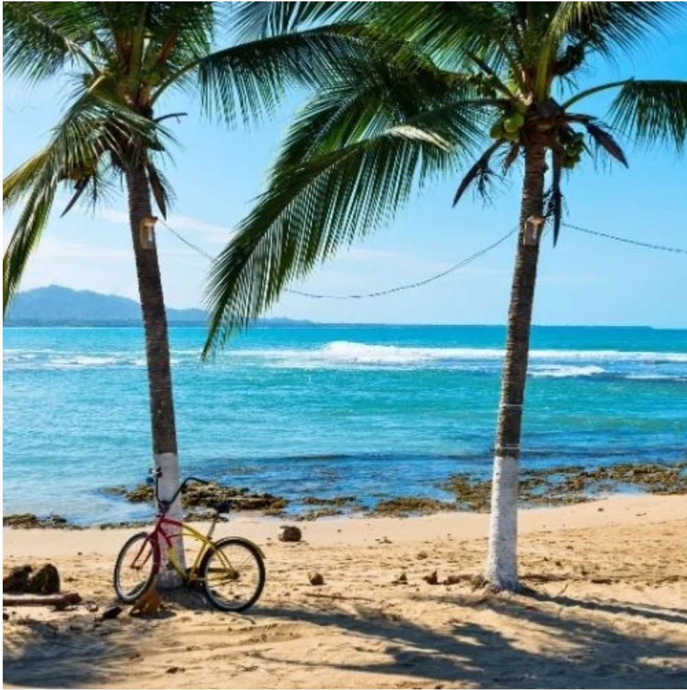
Vélo sur une plage de Puerto Viejo de Talamanca