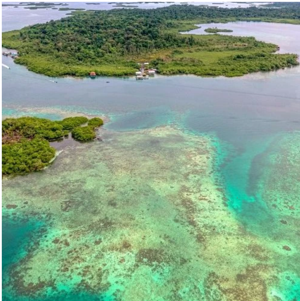
Les eaux cristallines de l'archipel Bocas del Toro

situé sur la magnifique Playa Bluff. L'après-midi, profitez d'un moment de détente sur l'une des plages de l'île, comme Starfish Beach , connue pour ses eaux calmes et ses étoiles de mer visibles près du rivage, Sandfly Beach , plus sauvage, ou Big Creek Beach , idéale pour une baignade rafraîchissante. Pour les amateurs de snorkeling, les récifs coralliens de la région dévoilent une faune sous-marine colorée. En soirée, admirez le coucher du soleil sur l'océan.