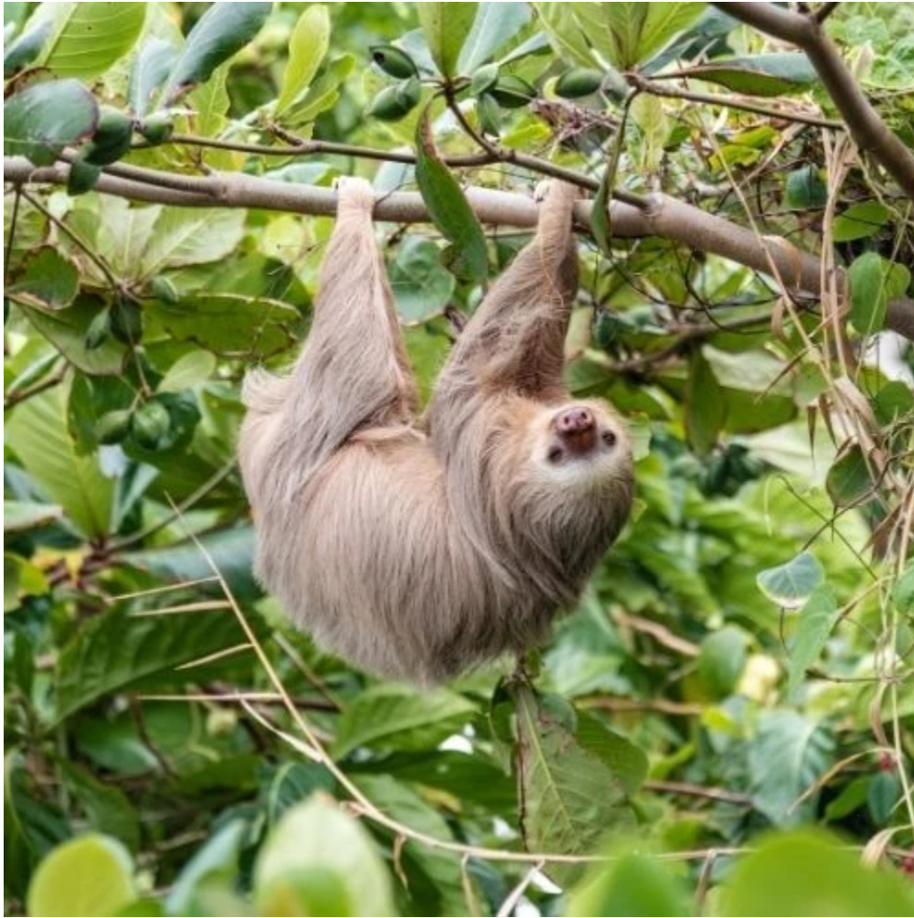
Paresseux d'Hoffmann à deux doigts (Choloepus Hoffmanni) dans le parc de Cahuita