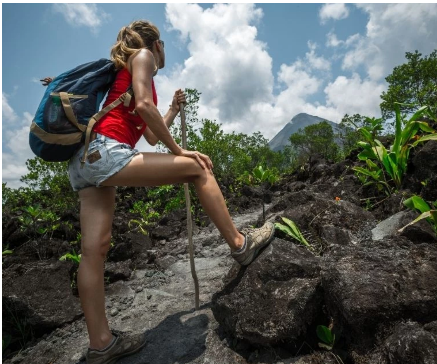
Randonneuse regardant le volcan Arenal à l'horizon