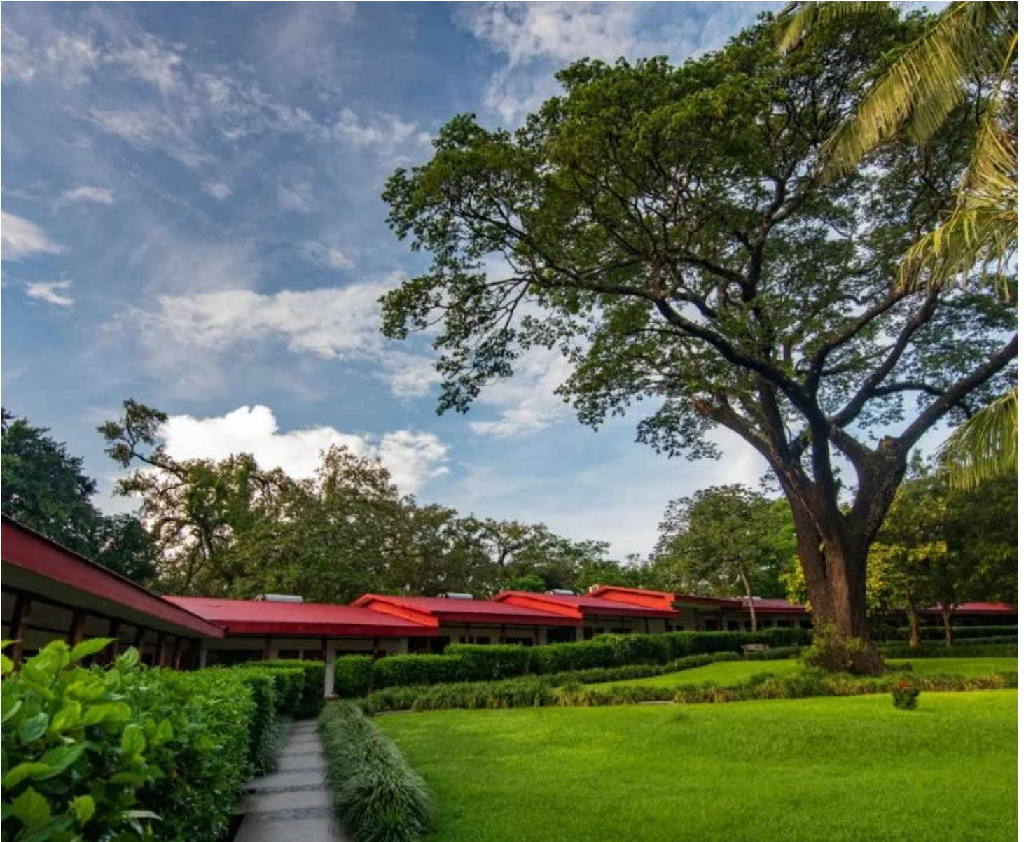
Les jardins de l'hacienda Guachipelin

À votre arrivée, vous restituerez votre véhicule de location avant de vous envoler vers Paris. Nuit à bord.