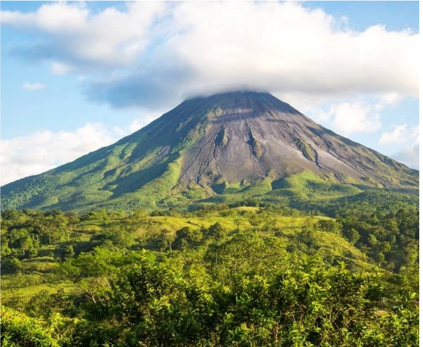
Cône du Volcan Arenal