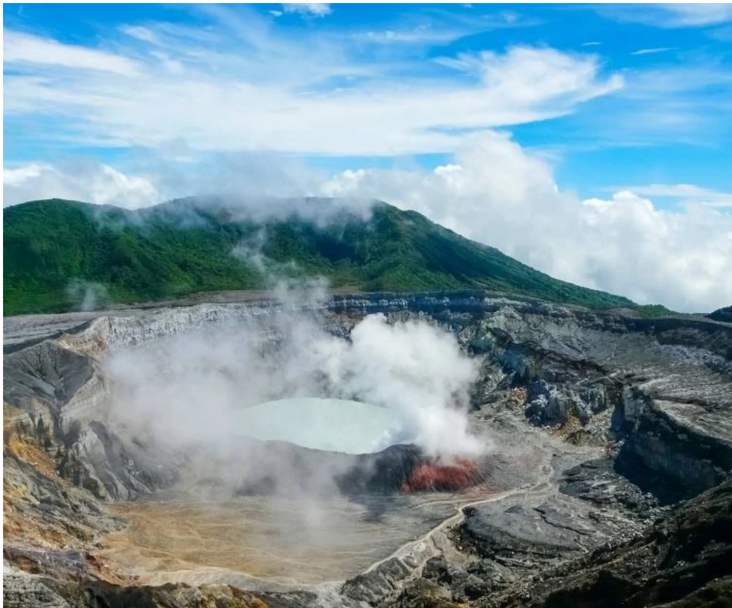
Cratère du volcan Poas