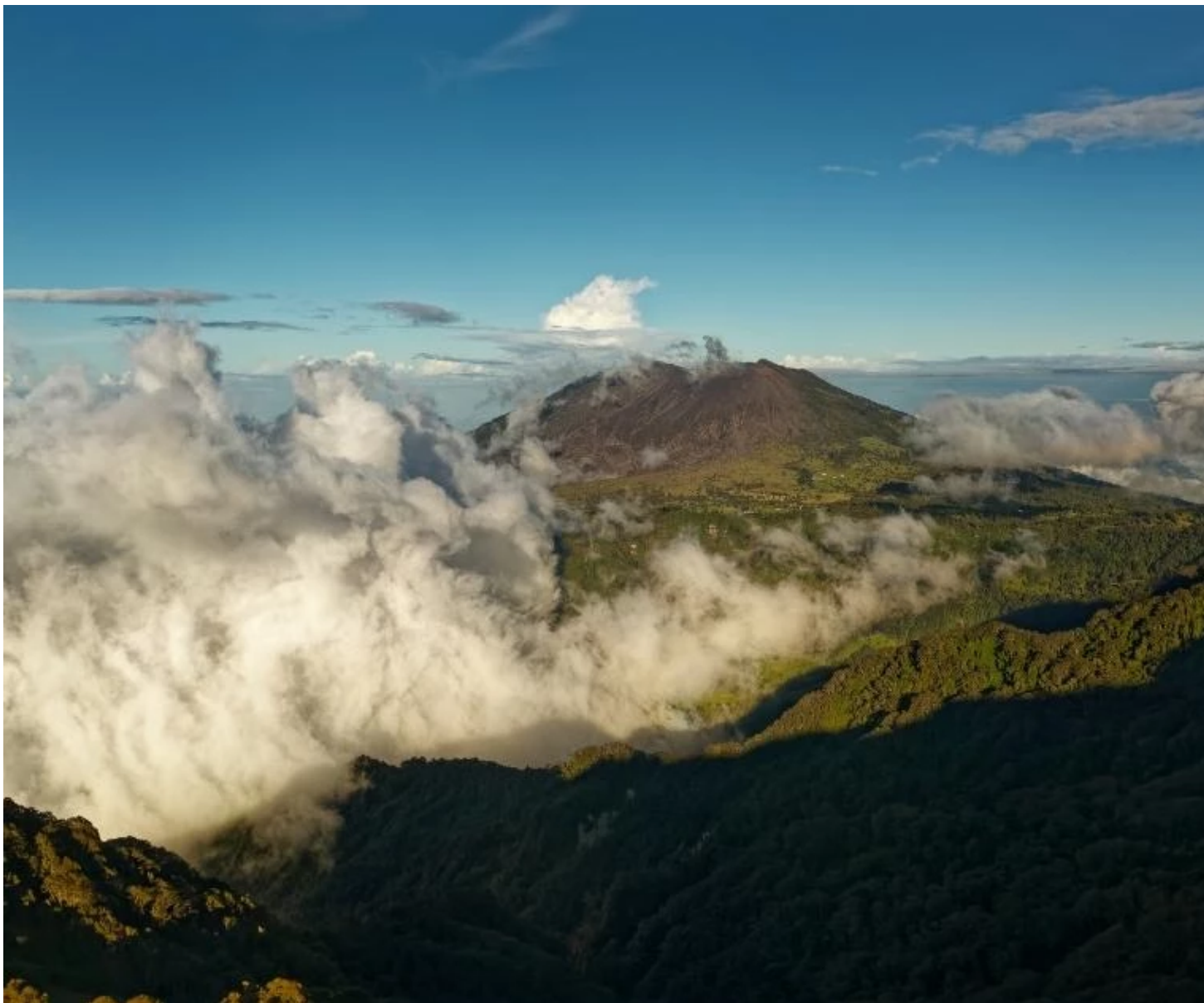
Vue sur le volcan Turrialba depuis le parc du Volcan Irazu