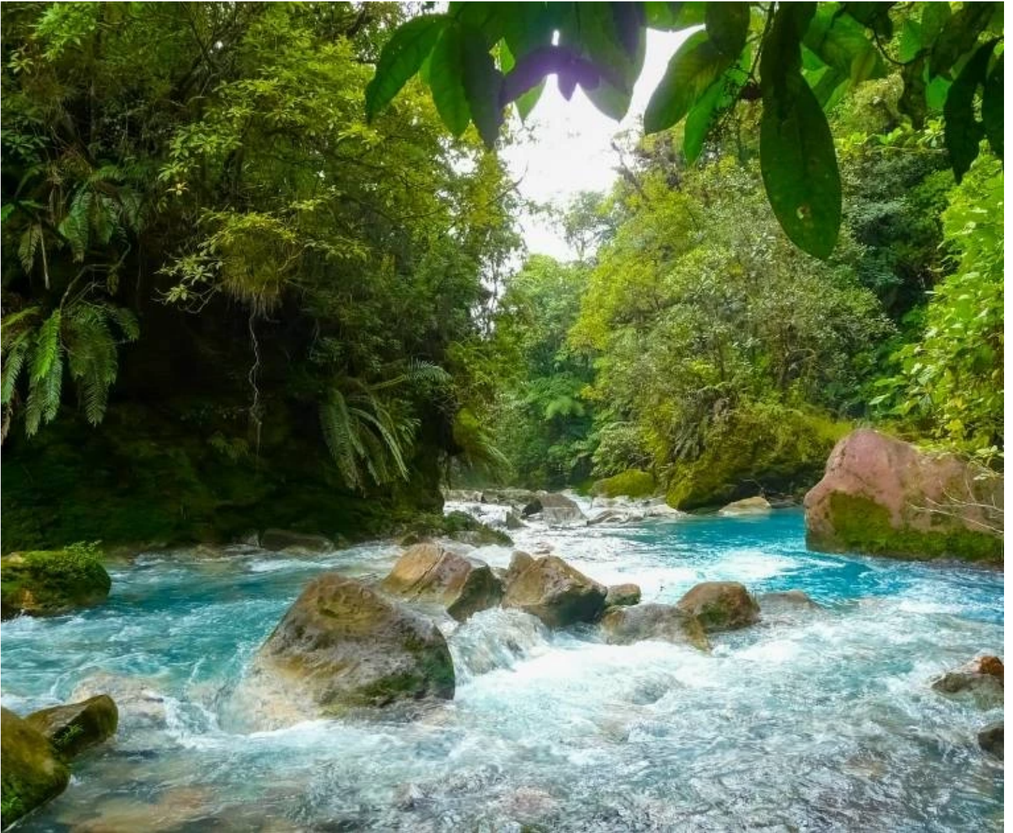
Les eaux du Rio Celeste dans le parc du Volcan Tenorio