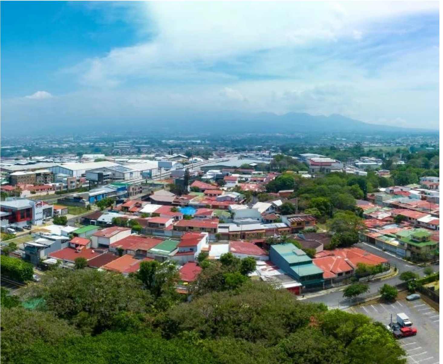
Vue aérienne sur la capitale San José