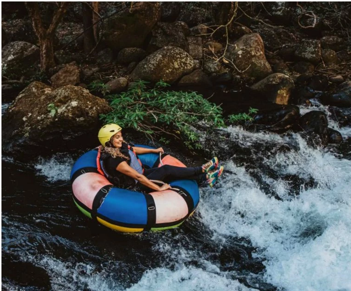
Tubing à Rincon de la Vieja