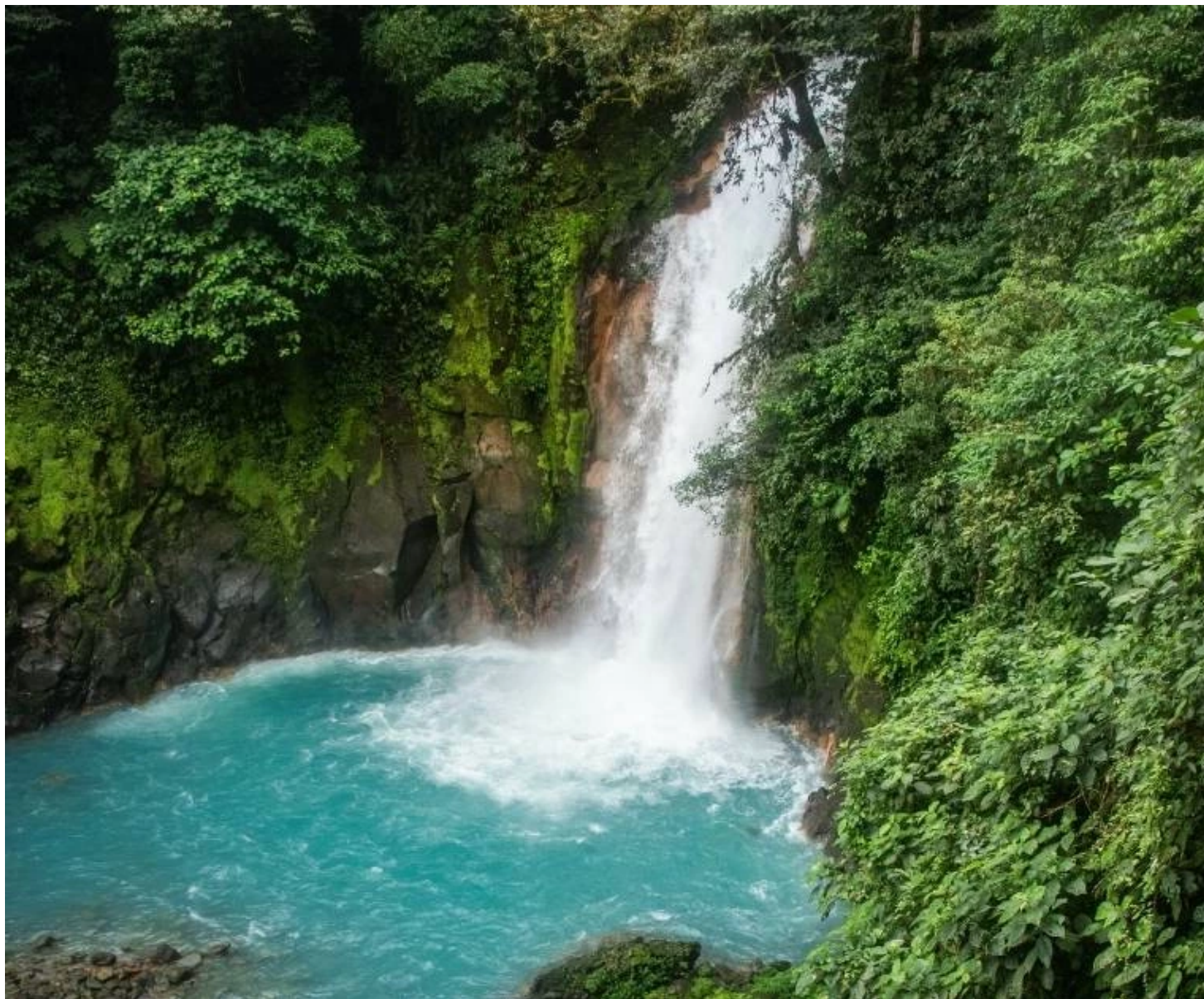
Cascade turquoise du Rio Celeste dans le parc du Volcan Tenorio