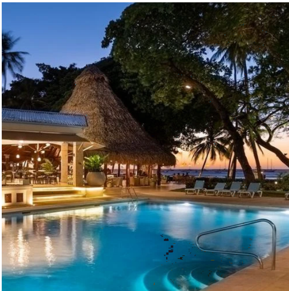
Piscine de bord de mer de l'hôtel Tamarindo Diria

À votre arrivée, installez-vous confortablement dans votre chambre Family Pool View à l'hôtel Tamarindo Diria 4* , où vous pourrez profiter de la vue imprenable sur l'océan et de la tranquillité de l'environnement. Prenez le temps de découvrir les trois piscines de l'hôtel, dont une en bord de mer, et laissez-vous envoûter par le coucher de soleil sur la plage. Tamarindo offre également une multitude d'activités nautiques comme le surf ou la plongée.