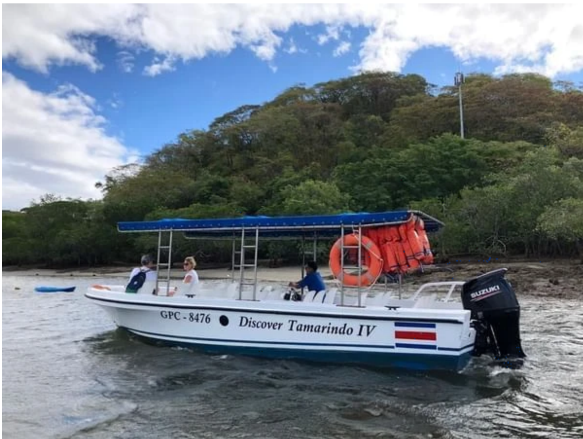
Promenade en bateau dans les mangroves autour de Tamarindo

En soirée, participez à une excursion nocturne pour observer la nidification des tortues Baulas (en saison), une expérience rare et émouvante.