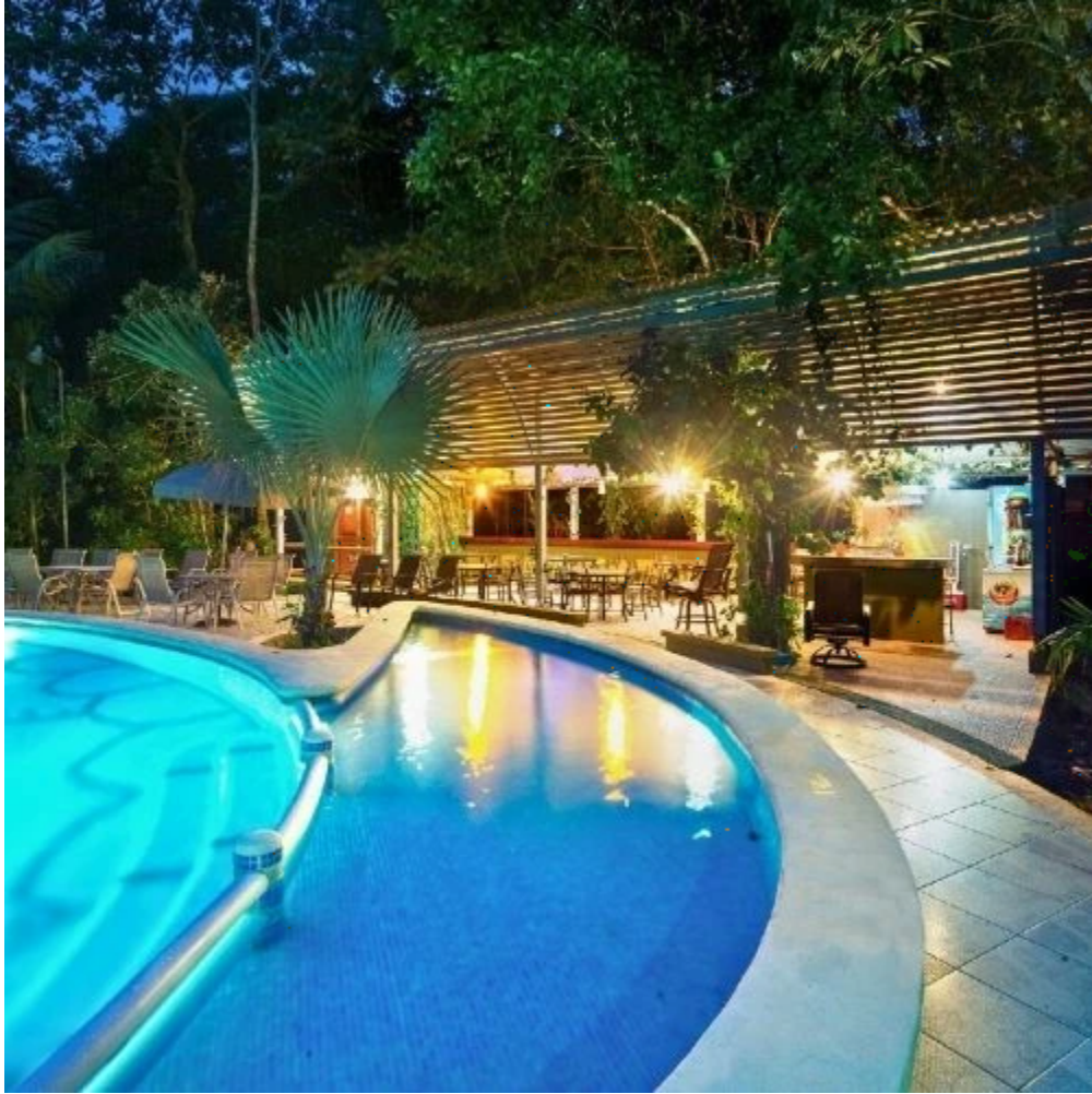
Piscine de l'hôtel Evergreen à Tortuguero