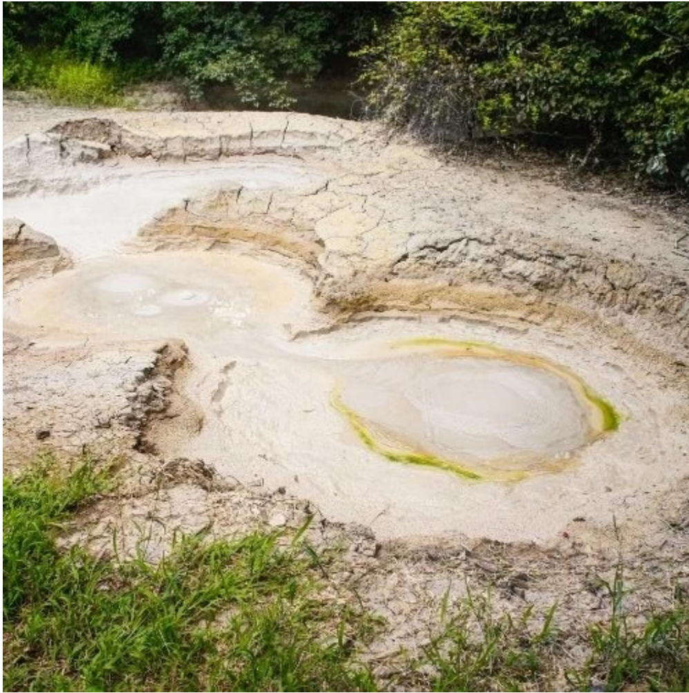
Boue chaude et sulfureuse, pailas du parc du volcan Rincon de la Vieja