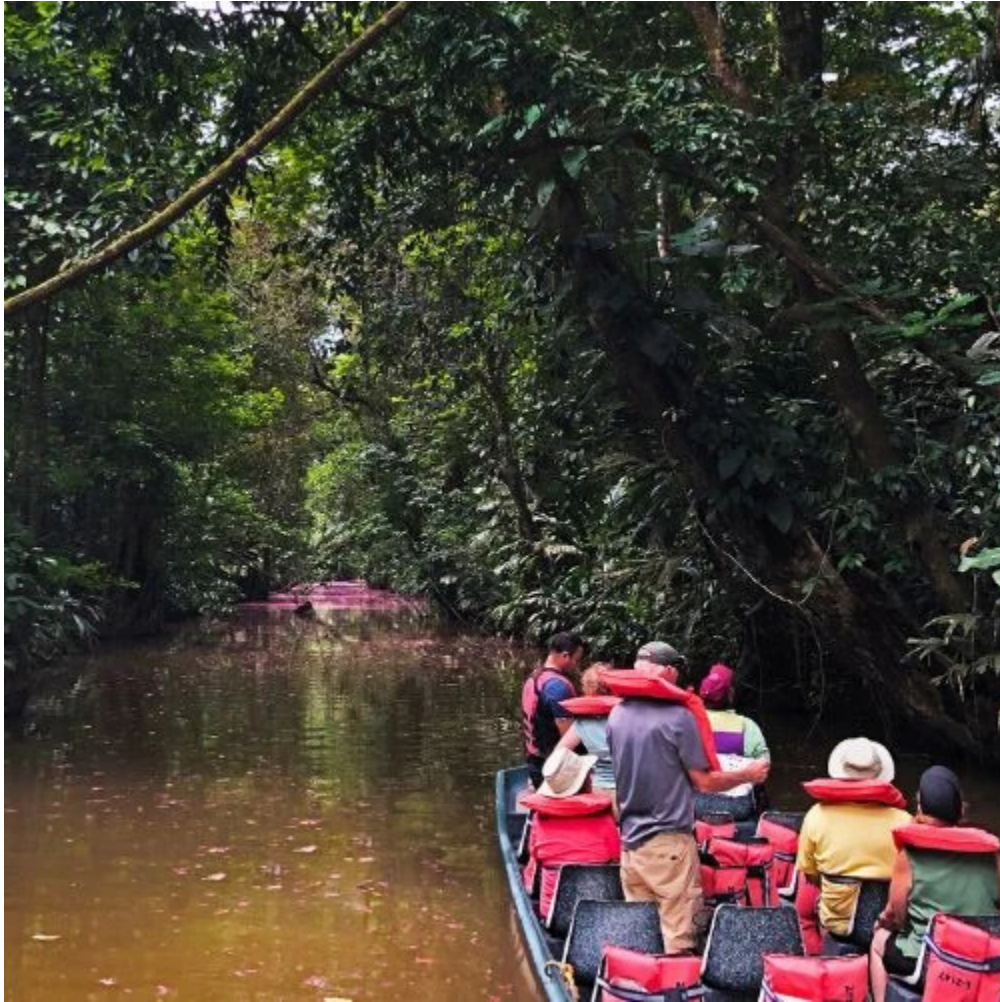
Visite guidée en bateau à travers les magnifiques canaux de Tortuguero