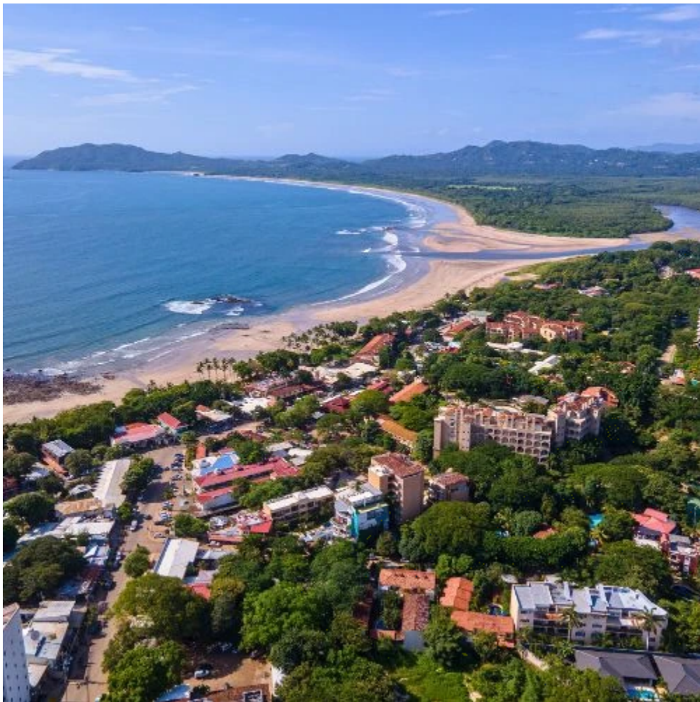
Belle vue aérienne sur la plage et la ville de Tamarindo

Après avoir profité de vos derniers instants à Tamarindo, prenez la route pour San José. Sur le chemin, vous aurez une dernière vue imprenable sur les paysages côtiers du Pacifique. Arrivé à Alajuela, restituez votre véhicule avant de prendre votre vol retour. Nuit à bord.