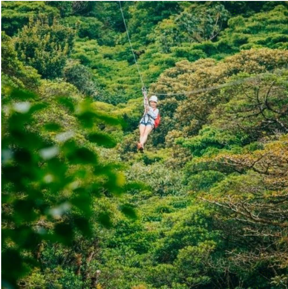
Tyrolienne du parc Selvatura à Monteverde

Monteverde , connue pour son fromage artisanal, regorge de trésors à explorer. Baladez-vous dans la ville ou aventurez-vous dans les forêts environnantes. La réserve de Curi-Cancha est parfaite pour observer des oiseaux colorés, et les ponts suspendus ou les tyroliennes du Selvatura Park offrent une vue impressionnante sur la canopée avec une belle montée d'adrénaline. Vous pouvez aussi aller vous baigner dans les piscines autour de la cascade San Luis , visiter les jardins des papillons , ou encore découvrir l'étang des grenouilles bleues.