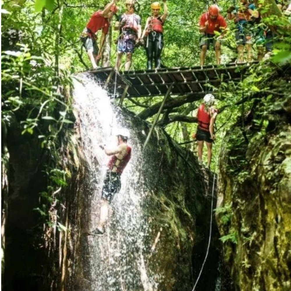
Descente en rappel le long d'une cascade à Rincon de la Vieja

Laissez-vous séduire par les bienfaits des saunas naturels et des bains de boue volcanique , ou optez pour des activités plus aventureuses telles que le tubbing (bouée) sur le Rio Negro, le rafting sur le Rio Corobici, le canyoning (descente en rappel) dans les cascades, ou une randonnée à cheval à la cascade Oropendola . Vous pouvez aussi visiter l' orphelinat de félins de Las Pumas , qui œuvre pour la préservation des espèces menacées du Costa Rica.