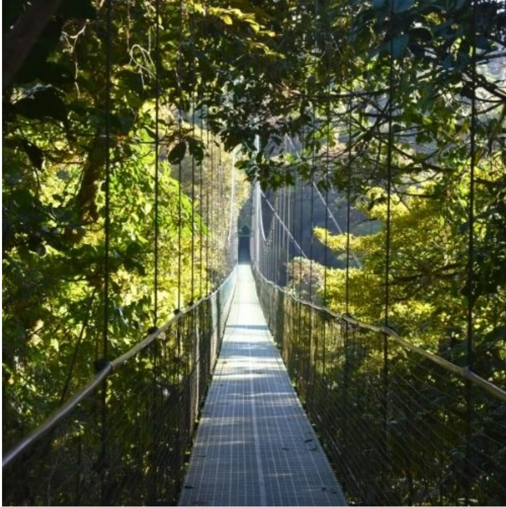
Pont suspendu de la forêt nuageuse de Monteverde