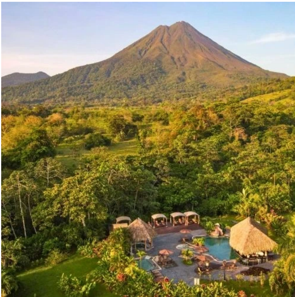
Sources thermales minérales Arenal Manoa Thermo à la Fortuna

Direction Arenal, avec ses paysages volcaniques spectaculaires et ses plantations de café. À votre arrivée, installez-vous dans une junior suite de l'hôtel Arenal Manoa & Hot Springs 4* , qui offre une vue imprenable sur le volcan. Profitez ensuite d'une baignade relaxante dans les sources thermales de l'hôtel, ou aller voir la magnifique cascade La Fortuna et sa piscine naturelle. Ces paysages époustouflants vous inviteront à explorer la nature dans toute sa splendeur.