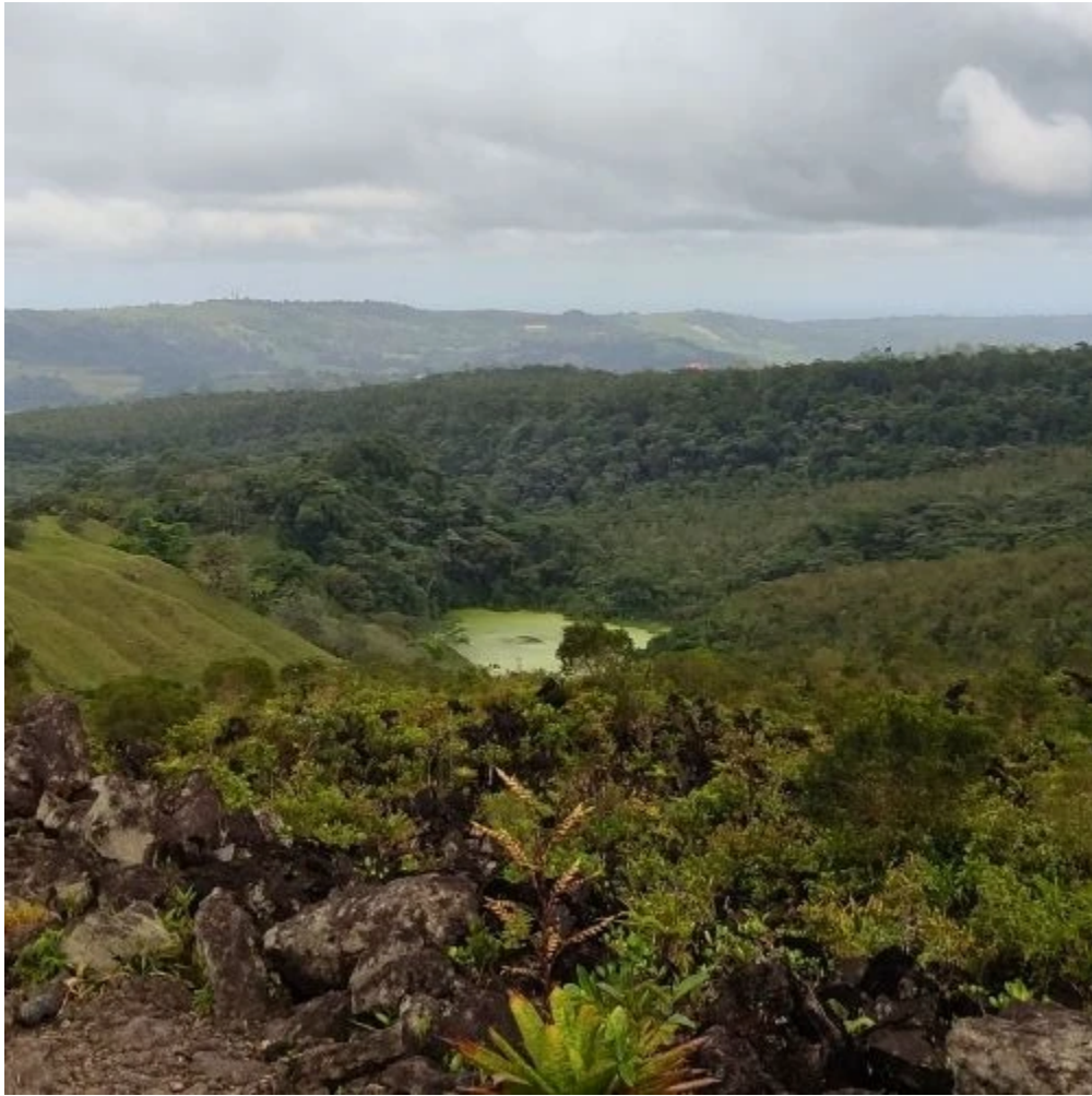
Vue sur la lagune verte depuis le Sentier 1968 à Arenal