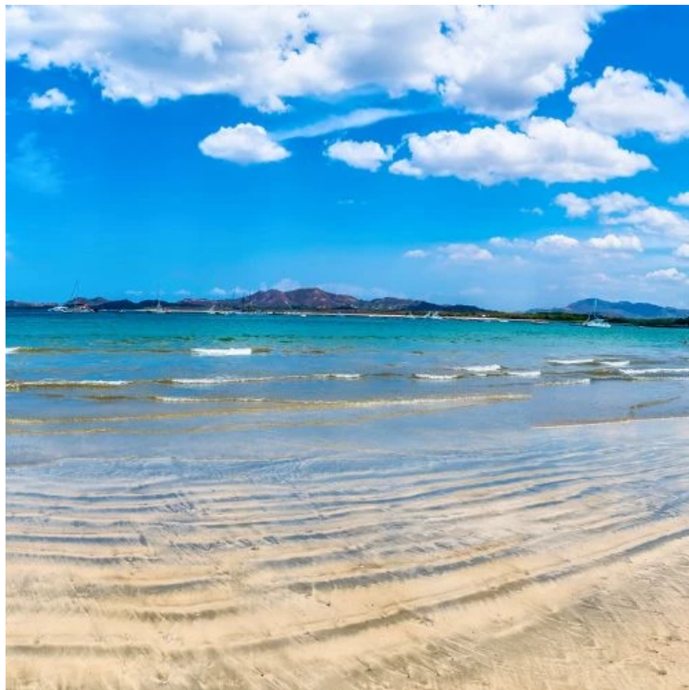
La plage de Tamarindo pendant la saison sèche